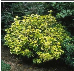
Arbuste Choisya ternata 'sundance' Oranger du mexique 'sundance'

Le + écolo : attire les abeilles au printemps. Les oiseaux apprécient les pommes une fois qu'elles ont gelées.