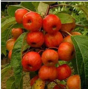
Arbre Malus 'Evereste' Perpetu Pommier d'ornement Evereste

Un beau petit arbre qui est enchanteur au moment de sa floraison. Ses fleurs sont en forme de tulipe ouverte d'un rose pourpre foncé remarquable, Il est caractéristique des jardins asiatiques mais peu pousser en terre non acide si elle n'est pas trop calcaire.