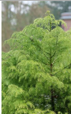
Arbre Cryptomeria japonica elegans viridis Cèdre du japon 'elegans viridis'

Un arbre asiatique très typé qui sera une pièce maîtresse du jardin tout en restant petit. Feuillage très divisé, rouge pourpre jusqu'en fin d'été et rouge orangé en automne.