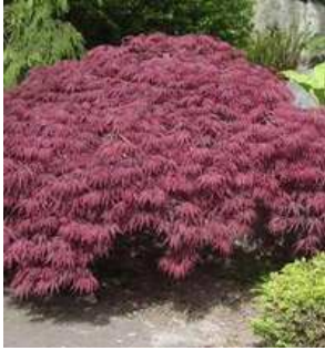
Arbre Acer palmatum dissectum atropurpureum Erable du japon 'Dissectum Atropurpureum'

Un arbre asiatique très typé qui sera une pièce maîtresse du jardin tout en restant petit. Feuillage très divisé, rouge pourpre jusqu'en fin d'été et rouge orangé en automne.